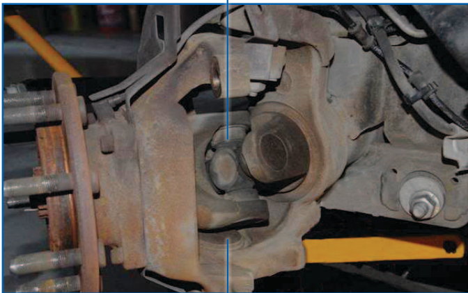
OBSERVE EL ESPACIO LIBRE LIMITADO